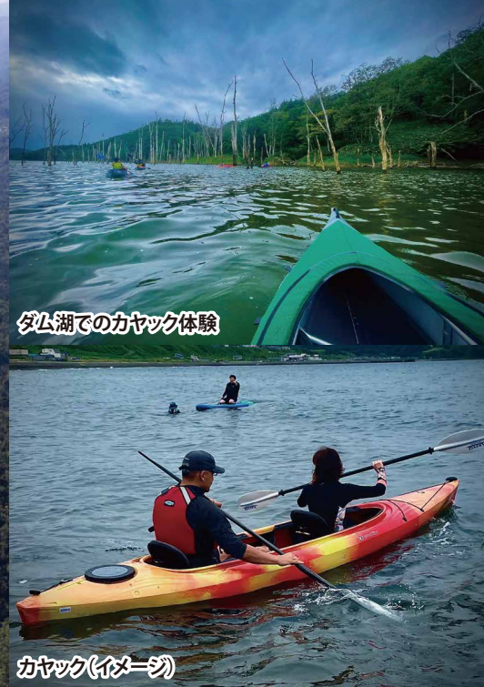
ダム湖でのカヤック体験