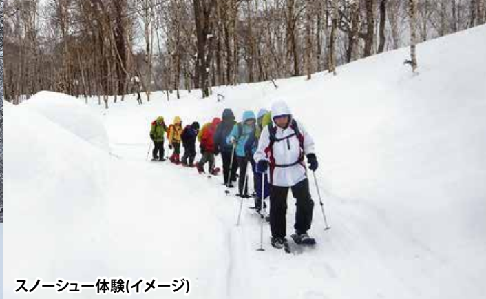
スノーシュー体験(イメージ)