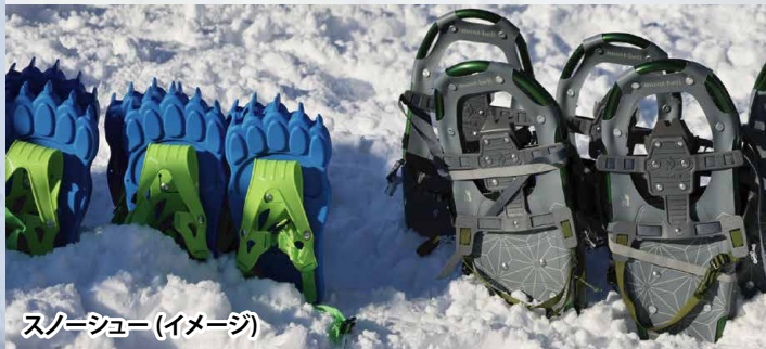
スノーシュー (イメージ)